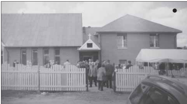
1. Tuutarin uusi kivikirkko sijaitsee nykyisessä Mozhaiski taajamassa korkean (176 metriä merepinnan yläpuolella) Äijänmäen koillisella rinnalla

2. Arkkitehti Pentti Kärki – Tuutarin kirkon projektin tekijä